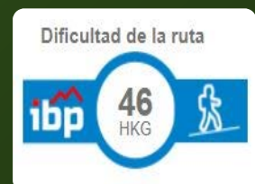
Taula comparativa IBP Index