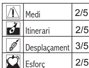
VALORACIÓ RUTA d'1 a 5

Seguim carenejant camp a través al NE vers una pista que discorre pels vessants meridionals de la Pacheca, aquesta davalla al coll de Benacatacera per on discorre el camí vell d'Aras. Des del coll seguim el camí cap a llevant davallant al llogaret de Baldoivar. Hem de creuar l'aldea i cercar el vell camí tragner que per la font de la Sapera i las Peñuelas ens portarà a l'ermita de la Puríssima des de la qual podem sotjar el singular paisatge del castell i vila de Alpuente on acaba l'excursió.