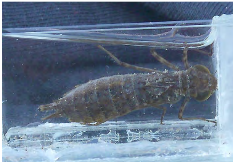
Ninfa de Libélula